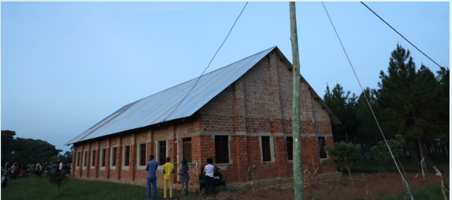
Nyumba ya Ibada katika Kitongoji cha Mkombozi, Kata ya Muganza, wilayani Chato ambayo imeunganishiwa umeme kupitia mradi wa usambazaji umeme vijijini.