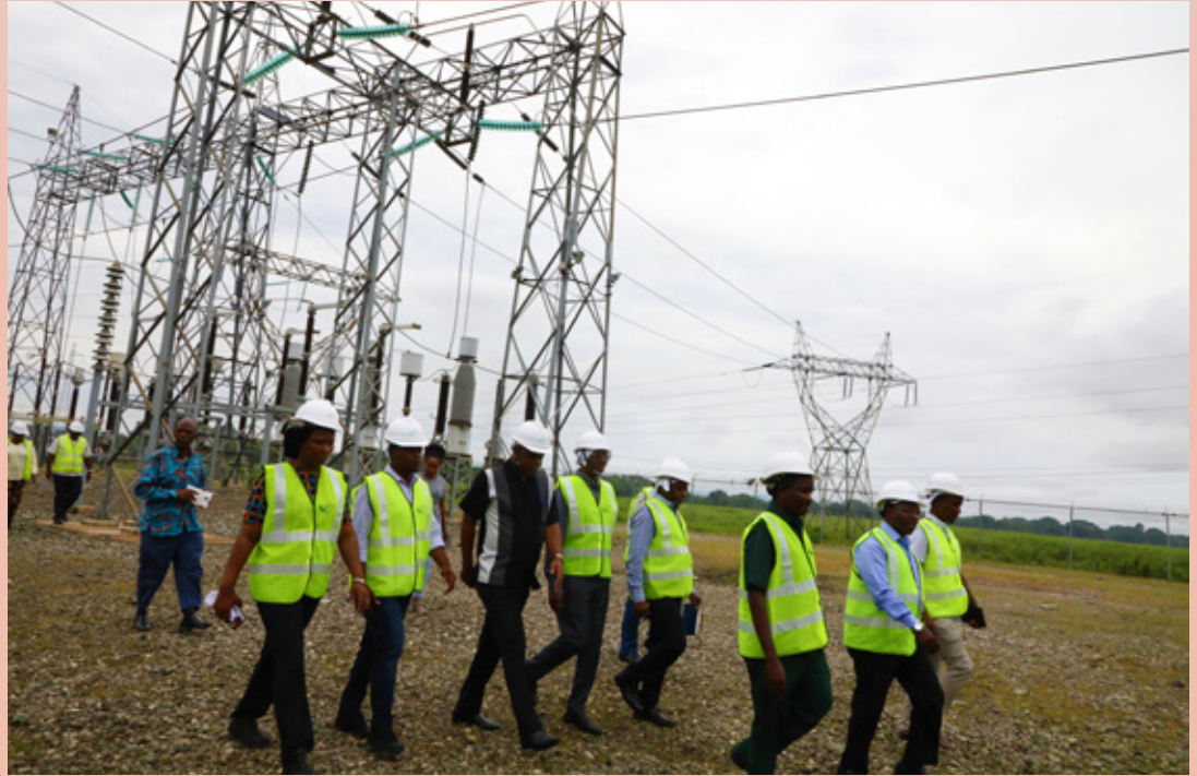
Waziri wa Nishati, Dkt. Medard Kalemani (mbele, katikati), akikagua kituo cha kupoza umeme katika Kituo cha umeme cha Kidatu mkoani Morogoro. Pamoja naye ni watendaji kutoka Wizara ya Nishati na Shirika la Umeme Tanzania (TANESCO).