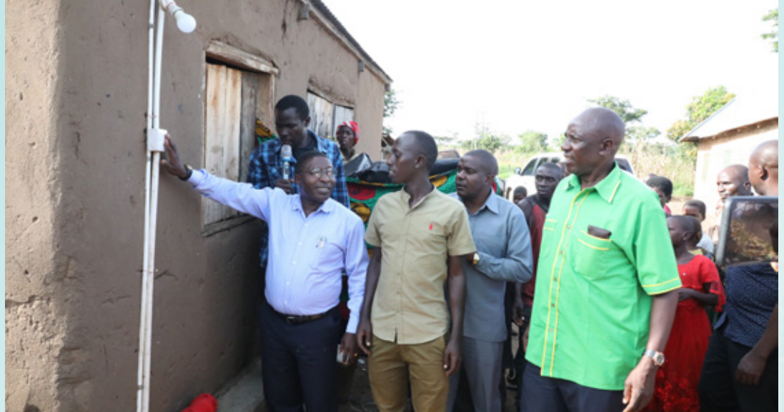
Waziri wa Nishati, Mhe. Dkt. Medard Kalemani, akiwasha umeme katika moja ya nyumba zilizounganishiwa umeme kwenye Kitongoji cha Mwamatome, Kata ya Bwongera, wilayani Chato, Mkoa wa Geita.

Kalemani ametoa angalizo kwa watendaji wa Shirika la Umeme Tanzania (TANESCO) kuwa, wamebakiwa na mwezi mmoja na nusu tu wa kuwaunganishia umeme wateja wote waliolipia umeme nchini.