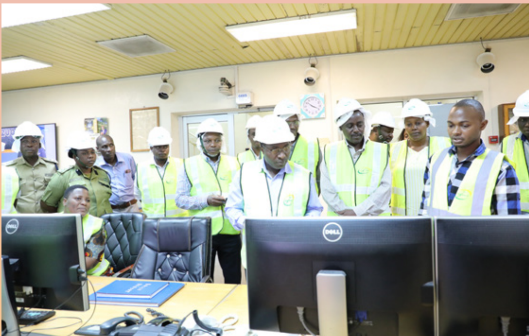
Waziri wa Nishati, Dkt. Medard Kalemani (katikati), pamoja na watendaji kutoka Wizara ya Nishati na Shirika la Umeme Tanzania (TANESCO) wakiwa katika chumba cha kuongozea mitambo katika kituo cha umeme cha Kidatu mkoani Morogoro.

Aidha, akiwa kwenye kituo hicho, Dkt. Kalemani alikagua mitambo ya kupoza umeme na kukuta mashine moja haifanyi kazi kutoka Septemba