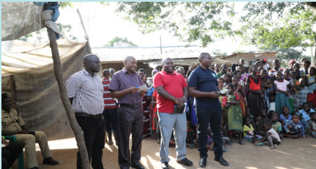
Wataalam kutoka Wizara ya Nishati, Shirika la Umeme Tanzania (TANESCO) na Wakala wa Nishati Vijijini (REA), wakimsikiliza Waziri wa Nishati, Mhe. Dkt. Medard Kalemani (hayupo pichani), wakati akizungumza na wananchi wa Kitongoji wa Mwamatome, wilayani Chato, Mkoa wa Geita.