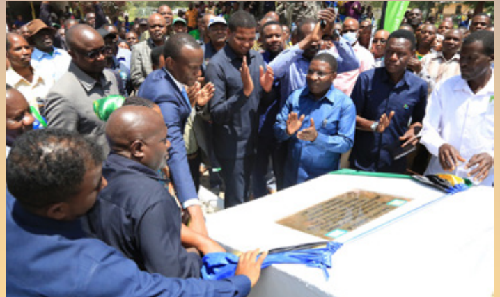
Waziri wa Nishati, Dkt. Medard Kalemani (katikati) akiweka jiwe la msingi kuashiria uzinduzi rasmi wa kitaifa, mradi wa usambazaji wa Umeme Vijijini, Awamu ya Tatu, Mzunguko wa Pili, uliofanyika, Machi 15, 2021 katika kijiji cha Ugaka wilayani Igunga mkoani Tabora.

Alisema kuwa kwamantiki hiyo, hakuna kuongeza muda wa ziada kwa mkandarasi yeyote atayeshindwa ama kuchelewa kukamilisha mradi huo kwa muda uliopangwa, na atayeshindwa