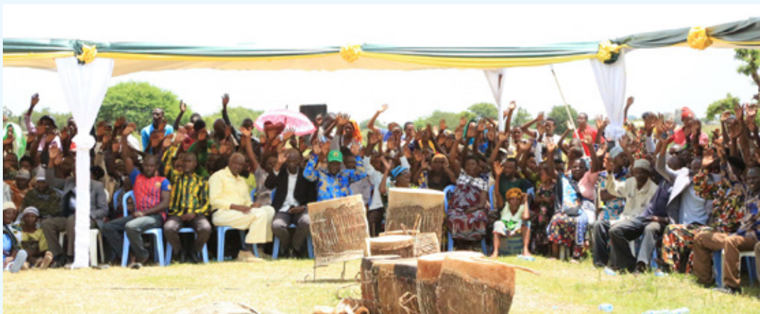
Baadhi ya wakazi wa Kijiji cha Imalilo wakimsikiliza Waziri wa Nishati, Dkt. Medard Kalemani (hayupo pichani) wakati wa uwekaji wa jiwe la msingi na kuzindua Ujenzi wa Kituo cha Kupoza Umeme cha Imalilo kilichopo wilayani Bariadi mkoani Simiyu, Machi 3, 2021.

kuwaujenzi wa kituo hicho unatekelezwa na Shirika la Umeme Tanzania (TANESCO) kwa kutumia fedha za ndani shilingi Bilioni 75.