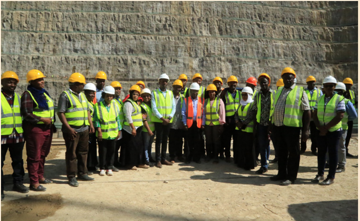
Waziri wa Nishati, Dkt. Medard Kalemani, (katikati) akiwa katika picha ya pamoja na Wajumbe wa Kamati ya Kudumu ya Bunge ya Nishati na Madini walipofanya ziara ya kukagua maendeleo ya ujenzi wa mradi wa JNHPP mkaoni Pwani, Machi 12, 2021.

“Kwa mara ya kwanza wakati wazo la kutekelezwa kwa mradi