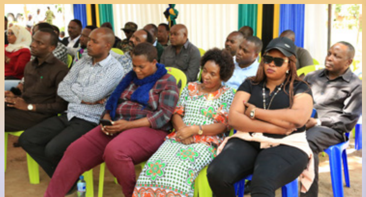
Baadhi ya Wajumbe wa Kamati ya Kudumu ya Bunge ya Nishati na Madini, wakimsikiliza Waziri wa Nishati, Dkt. Medard Kalemami (hayupo pichani), wakati wa ziara ya wajumbe hao ya kukagua maendeleo ya utekelezaji wa mradi wa kusambaza umeme vijijini na kuwasha Umeme katika shule ya Sekondari Tamabu, katika Kijiji cha Tabaruka wilayani Sengerema mkoani Mwanza, Machi 17, 2021.