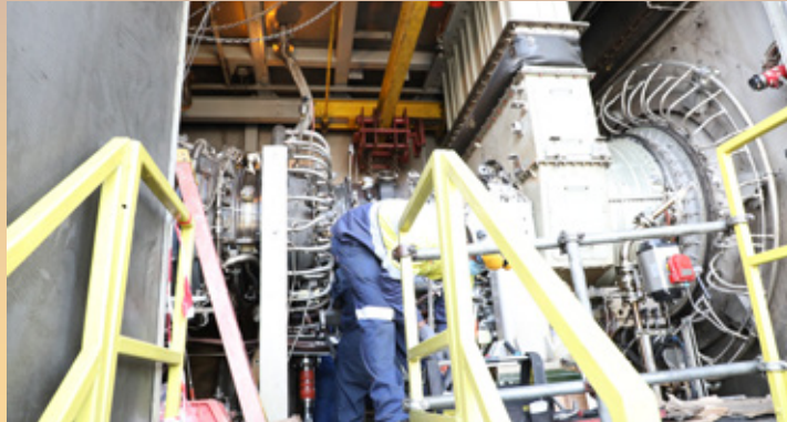
Mafundi wakiendelea na kazi ya utengenezaji wa moja ya mtambo wa umeme katika kituo cha umeme cha Songas kilichopo Ubungo mkoani Dar es Salaam.