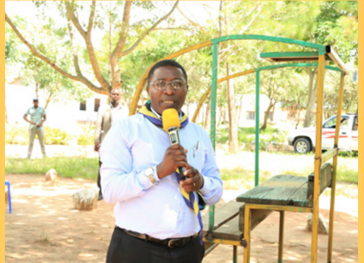
Waziri wa Nishati, Dkt. Medard Kalemani, akizungumza na wakazi wa Kijiji cha Tabaruka, wakati wa ziara ya wajumbe wa Kamati ya Kudumu ya Bunge ya Nishati na Madini ya kukagua maendeleo ya utekelezaji wa mradi wa kusambaza umeme Vijijini na kuwasha Umeme katika shule ya Sekondari Tamabu, katika Kijiji cha Tabaruka wilayani Sengerema mkoani Mwanza, Machi 17, 2021.