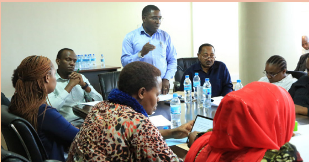
Waziri wa Nishati Dkt. Medard Kalemani (aliyesimama) akizungumza na Wajumbe wa Kamati ya Kudumu ya Bunge ya Nishati na Madini, wakati wa kikao cha kujadili biashara ya Mafuta nchini, kilichofanyika Jijini Dar es Salaam, Machi 13, 2021.