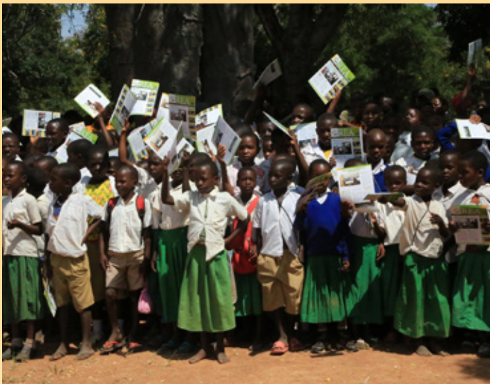
Baadhi ya wanafunzi wa shule ya msingi katika Kijiji cha Ugaka wakiwa wamenyoosha juu jarida linalochapisha habari za Wakala wa Nishati Vijijini (REA) kufurahia uzinduzi rasmi wa kitaifa wa mradi wa usambazaji umeme vijijini, Awamu ya Tatu, Mzunguko wa Pili, uliofanyika, Machi 15, 2021, katika kijiji hicho wilayani Igunga mkoani Tabora.

Aidha aliwataka wakandarasi hao kujitambulisha kwa uongozi wa vijiji, wilaya na mkoa kabla ya kuanza kazi na kuwaeleza viongozi hao ratiba za