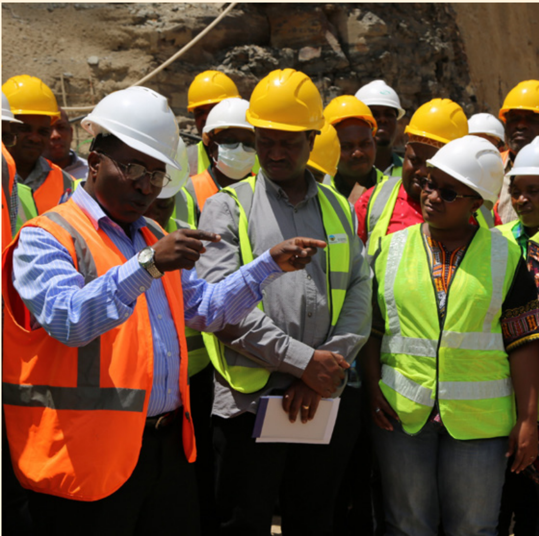
Waziri wa Nishati, Dkt. Medard Kalemani, (pili kushoto) akitoa maelezo kwa Wajumbe wa Kamati ya Kudumu ya Bunge ya Nishati na Madini walipofanya ziara ya kukagua maendeleo ya ujenzi wa mradi wa JNHPP mkoani Pwani, Machi 12, 2021.